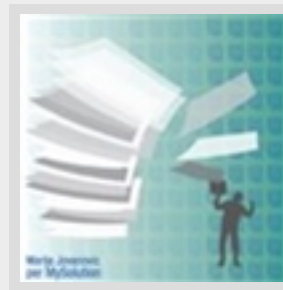
Fronteggiare il drago burocratico in azienda