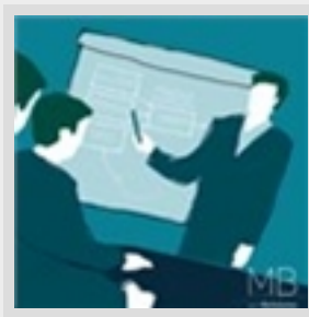
La leadership viene prima del leader